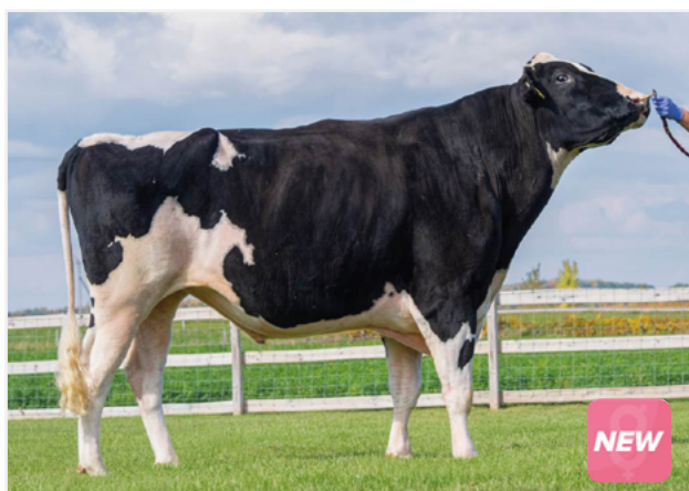
Bisabuelo: Genosource Captain-ET

Reg. H0840003283226265 26/9/24 B-CN: A2A2 K-CN: AB